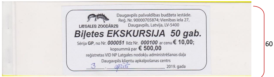
3.att. Ekskursiju biļešu iepakojuma vāka paraugs (izmēri, mm)