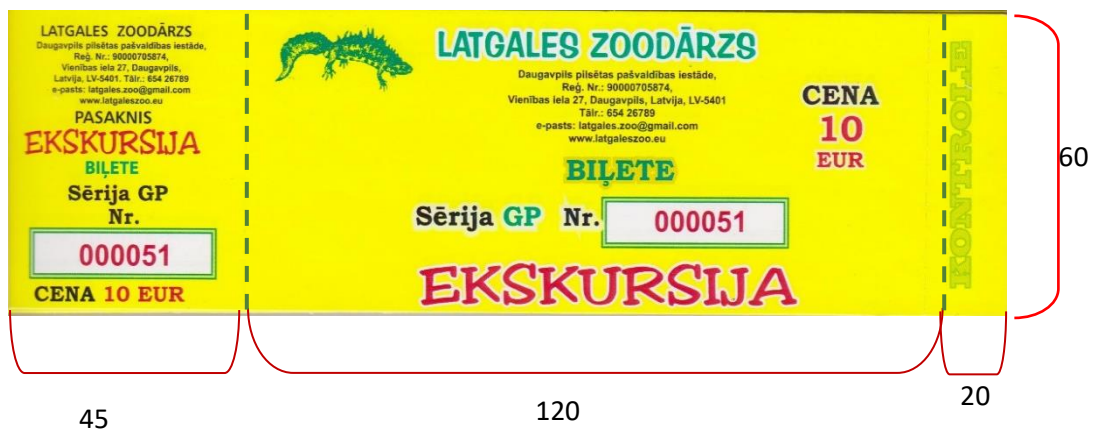
4.att. Ekskursiju biļetes paraugs (izmēri, mm)