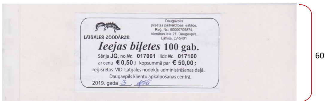
1.att. Ieejas biļešu iepakojuma vāka paraugs (izmēri, mm)