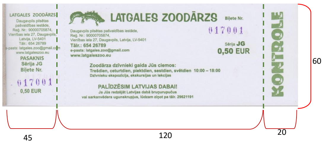
2.att. Ieejas biļetes paraugs (izmēri, mm)