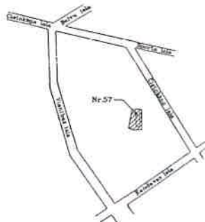
ZEMES IZVIETOJUMA SHĒMA