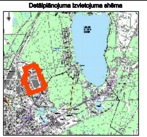
Detālpilnojuma teritorijas atrašanās vieta