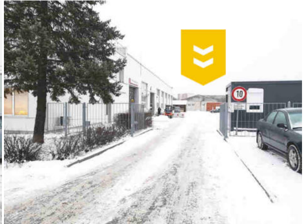
Iebraukšana uz teritoriju no piebraucamā ceļa – 1.Pasažieru ielas