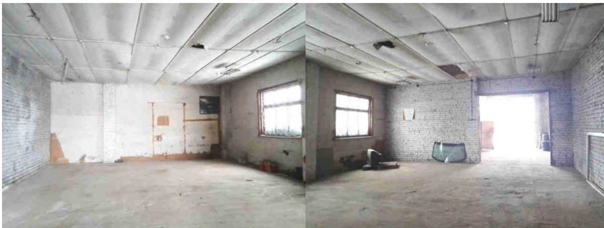
Noliktavas telpa Nr.1