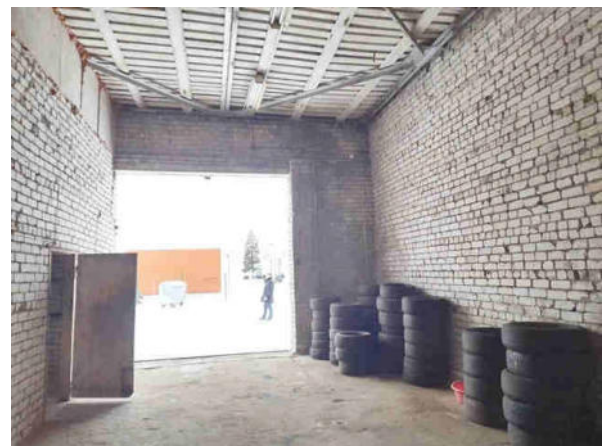
Noliktavas ēkas ar kad.apz. 0500 009 0801 004 telpu grupas (kad.apz.002) noliktavas telpa Nr.2