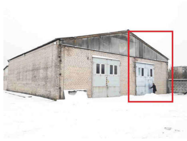
Skats uz noliktavas ēku (kad.apz.004), kurā atrodas vērtējamās telpas