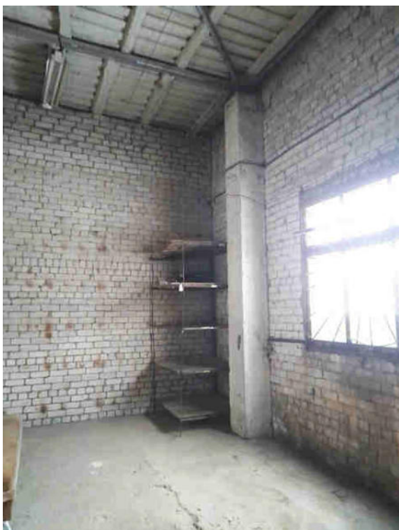
Noliktavas telpa Nr.3