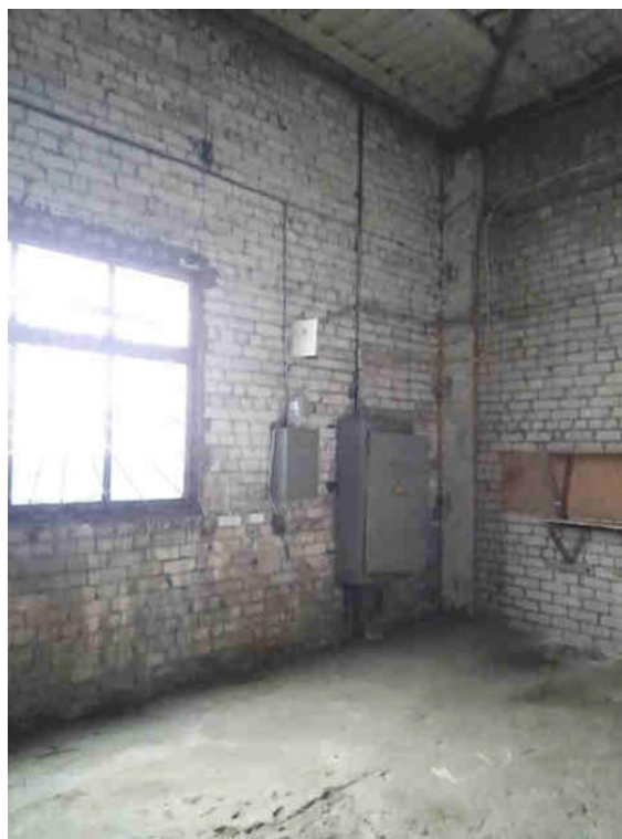
Noliktavas telpa Nr.4