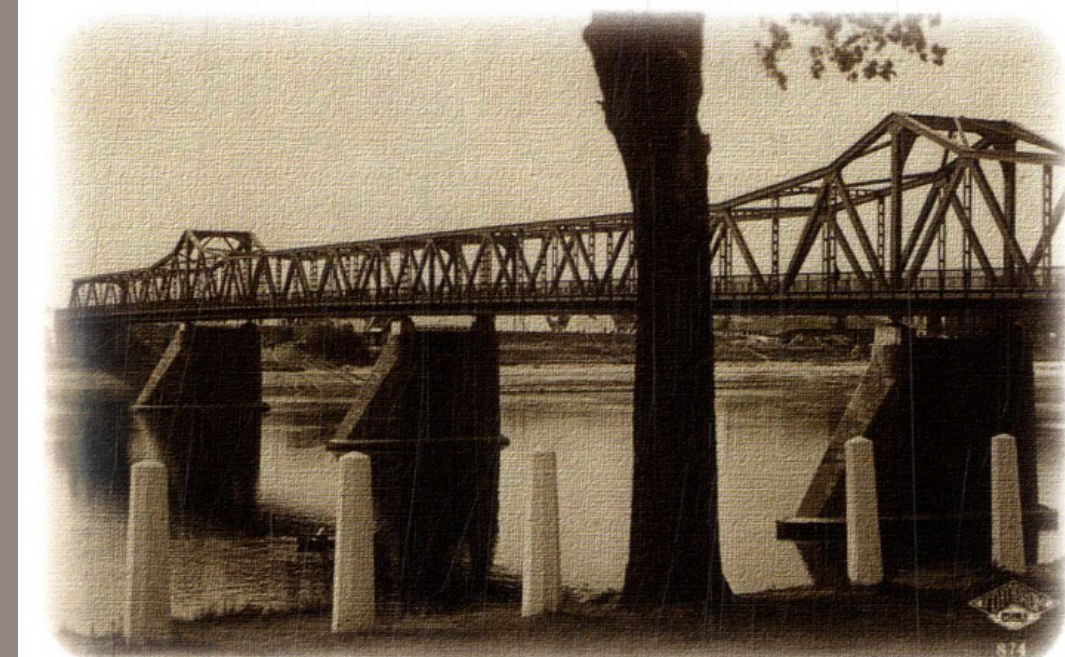
Vienības nams. 20.gs. 30.gadi. Vienības tilts. 20.gs. 30.gadi.